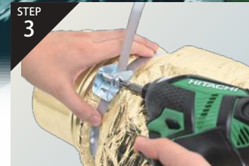
STEP 3 インパクトドライバーで締めます。