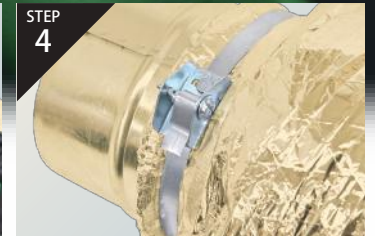
STEP 4 作業完了。

※画像は説明用イメージです。実際の施工商品とは異なりますので予めご了承ください。