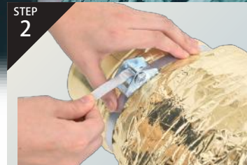
STEP 2 バンドの先を手前に引きます。