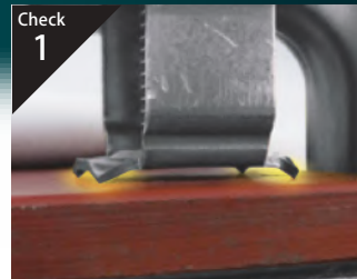
Check 1 ボルトを締めるとツメが食い込んで がっちり保持!