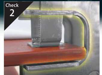
Check 2 コの字部分の強度をアップ!