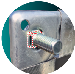
根角ボルト/赤い破線部分が根角。